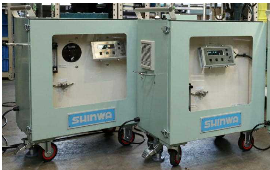
写真1 鏡面冷却式露点計測システム（台車式） 右：低露点仕様 左：通常露点仕様

静電容量式（高分子薄膜式・アルミ酸化薄膜式）の露点変換器の同時搭載も可能で、本露点計測システムを現場での静電容量式露点変換器の精度確認などにもご利用頂くことができます（オプション）。